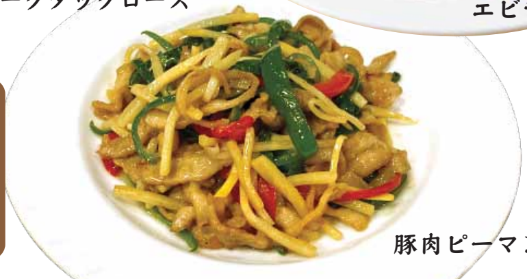
豚肉ピーマン炒め