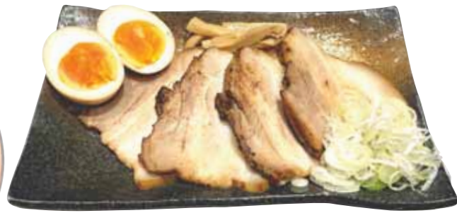
おつまみ三点盛り